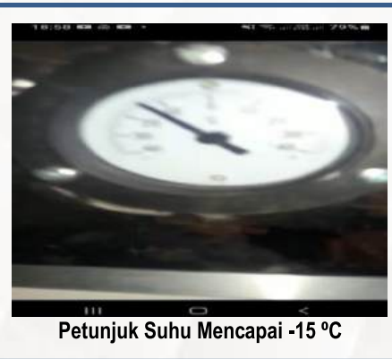
Petunjuk Suhu Mencapai -15 °C