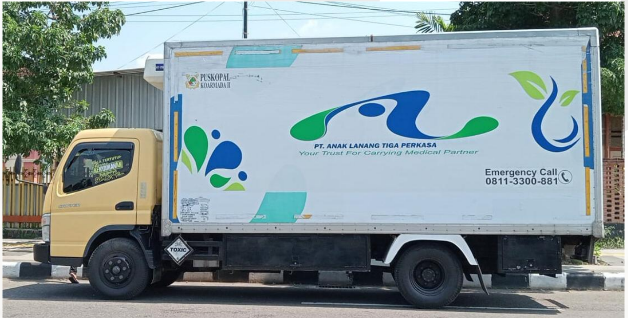
PT. Anak Lanang Tiga Perkasa

Selalu berkomitmen memperhatikan keselamatan petugas pengangkut limbah, dengan memastikan APD terpisah dari kabin kendaraan untuk menghindari terpaparnya petugas terhadap limbah yang diangkut