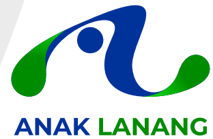
FOTO DAN SPESIFIKASI COLD STORAGE UNTUK FASYANKES PRODUKSI PT. ANAK LANANG TIGA PERKASA SURABAYA