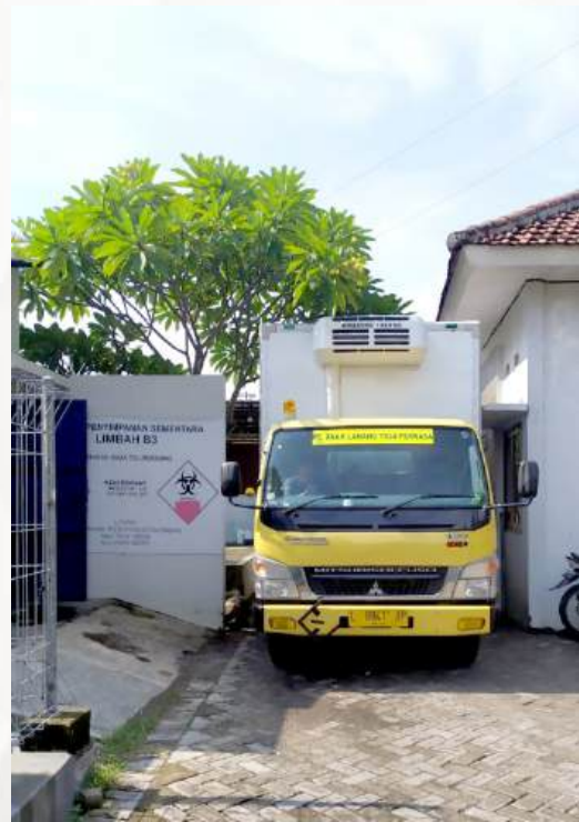
Pengangkutan Limbah B3 Fasyankes RSUD dr. Iskak Tulungagung Prov. Jawa Timur