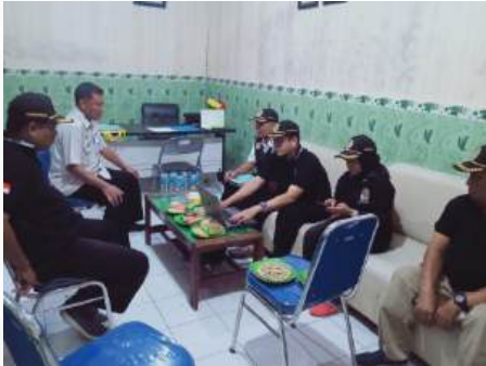
Koordinasi Dengan Dinas Kesehatan Kab. Lamongan terkait kerjasama pengangkutan Limbah B3 Fasyankes