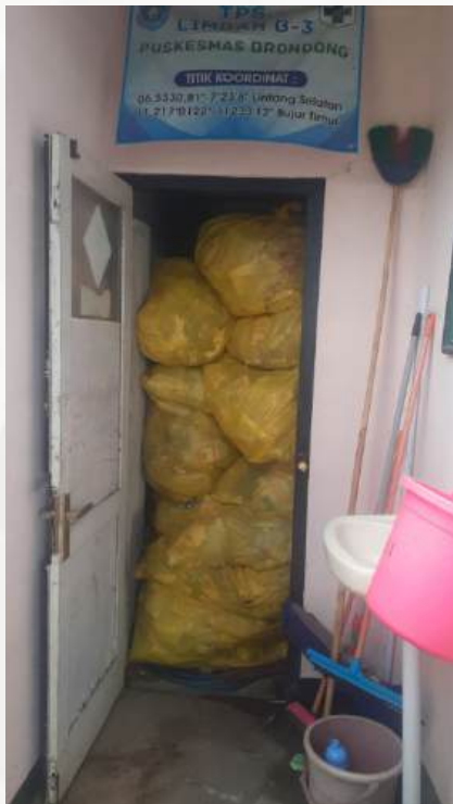
Pengangkutan Limbah B3 Fasyankes di Puskesmas Brondong Kab. Lamongan Prov. Jawa Timur