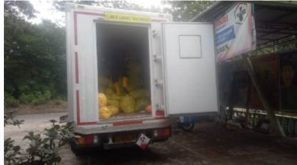
Pengangkutan Limbah B3 Fasyankes di Puskesmas Laren Kab. Lamongan Prov. Jawa Timur