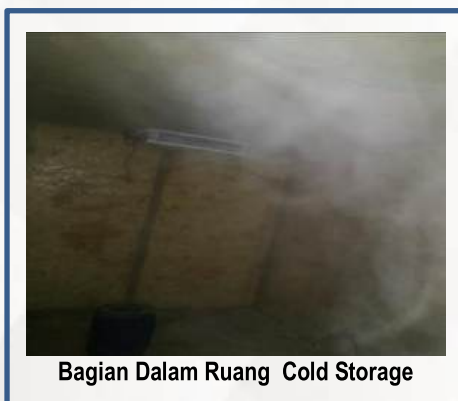
Bagian Dalam Ruang Cold Storage