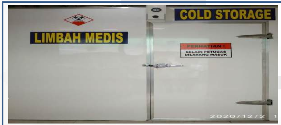
GAMBAR 1.: Bagian Depan Cold Storage Limbah Medis Untuk Fasyankes